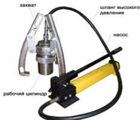
Рисунок 1. Сборочные детали магнитного захвата